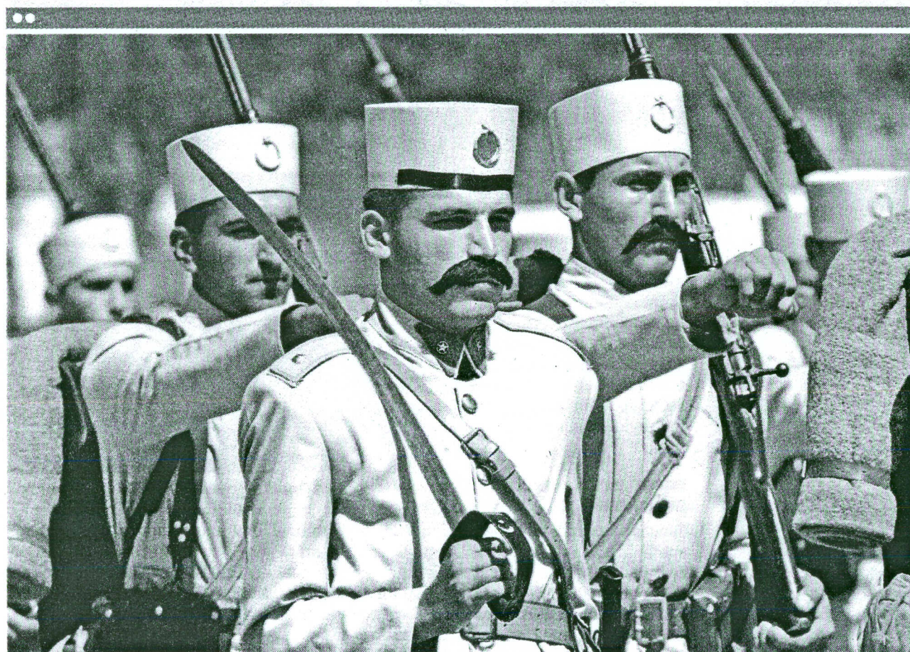
Participanți la o paradă purtând uniforme din timpul Imperiului Otoman